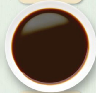
Salsa di soia