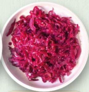
Cavolo rosso marinato