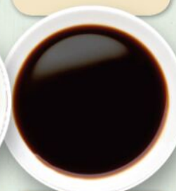
Salsa Poke Teriyaki