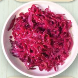
Cavolo rosso marinato