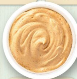
Salsa Spicy mayo