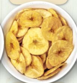
Chips di platano