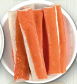
Surimi di granchio*