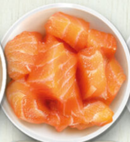
Salmone affumicato +1.50€