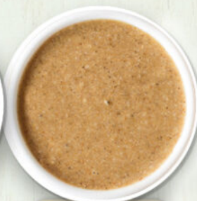
Salsa di sesamo