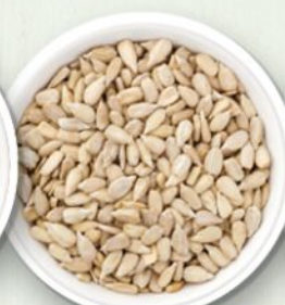
Semi di girasole