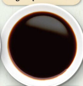
Salsa di soia (senza glutine)