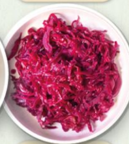
Cavolo rosso marinato