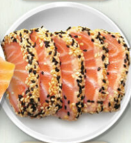
Sake tataki +1.50€