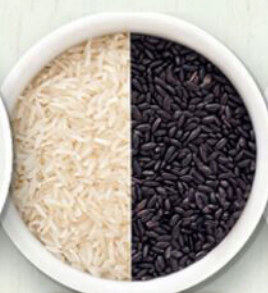
Riso misto di due tipi