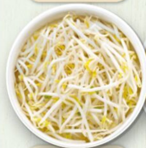
Germogli di soia