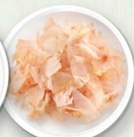
Scaglie di tonno affumicato