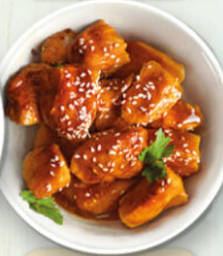
Pollo salsa teriyaki*

In caso di allergie e/o intolleranze preghiamo i Gentili Clienti di rivolgersi al personale, grazie!