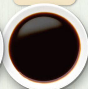
Salsa di soia